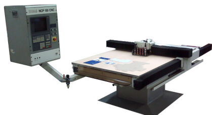
TABLE MULTIFONCTIONS RECONDITIONNEE NCP150-T

FICHE TECHNIQUE TABLE MULTIFONCTIONS ELCEDE NCP150-T