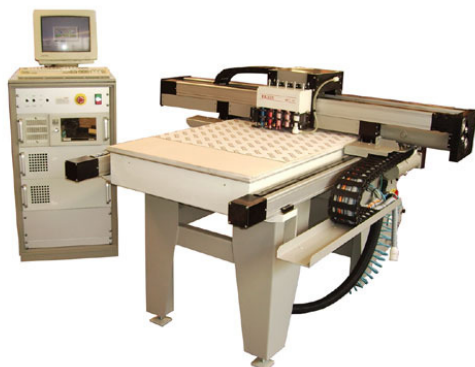
TABLE MULTIFONCTIONS RECONDITIONNEE

FICHE TECHNIQUE TABLE MULTIFONCTIONS ELCEDE NCP 160 T