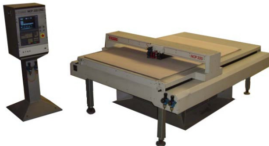
TABLE MULTIFONCTIONS RECONDITIONNEE